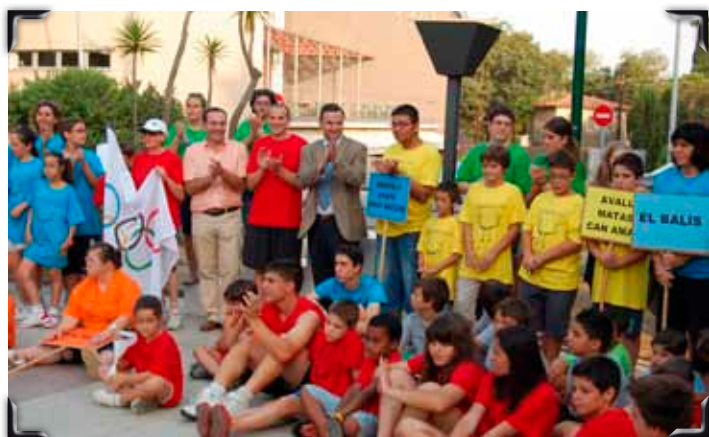
Foto de família amb els representants dels barris.