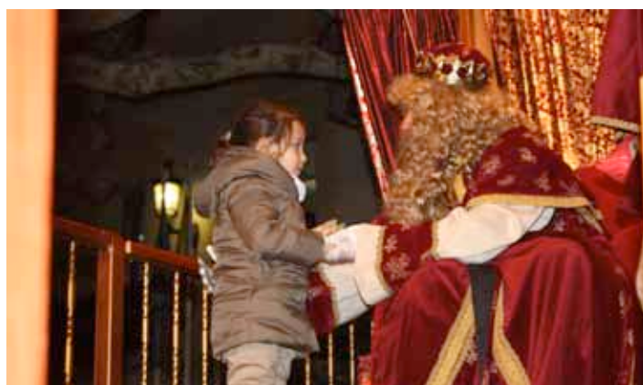
Cavalcada de Ses Majestats de l'Orient