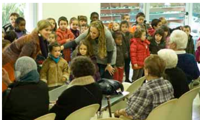
Cantada de nadales de l'escola Labandària al Casal de la Gent Gran