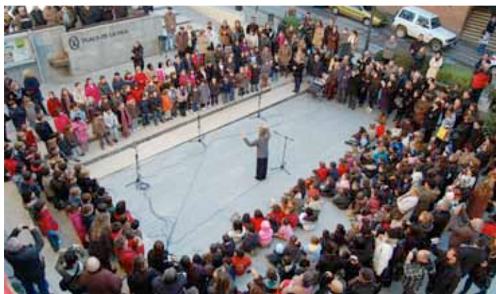
Cantada de nadales de les escoles a la Plaça de la Vila