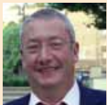
Carlos Bartomeu PP