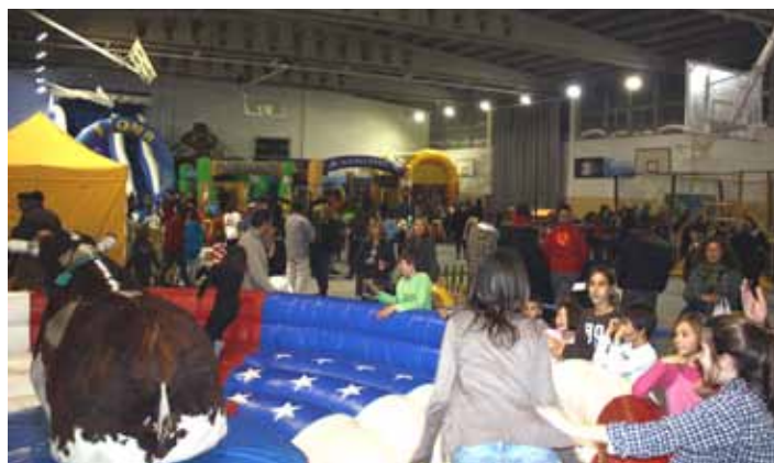
Parc de Nadal al pavelló