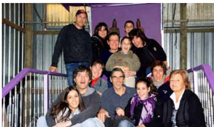
El Patronat de la Cavalcada preparant l'arribada dels Reis