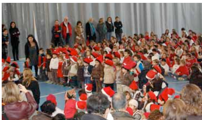
Concert de Nadales de l'escola Sant Andreu al pavelló