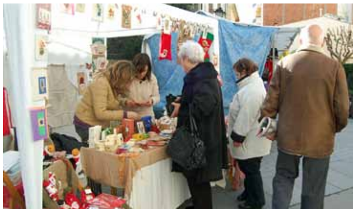
Fira de Nadal