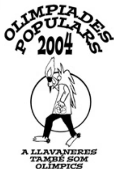
Els participants rebran una samarreta.

hibició com el taekwondo i actes lúdics com la baixada d'andròmines, amb molta acceptació. En les activitats de competició, els grups es formaran en funció de la zona del municipi on es viu. S'ha dividit Sant Andreu de Llavaneres en set zones: Can Sans, Sant Pere/el Balís, Bell-aire/Ametllareda, Canafort/el Puntó, Avall/Matas/Can Amat, el Centre i Montalt/Acatà/Grup Betlem. Els integrants d'aquestes zones de la vila competiran, amb un esperit sa i festiu, entre ells. Natació, bàsquet, atletisme, golf, ciclisme, vela, rem, futbol 7 o petanca són algunes de les disciplines que es faran. També es