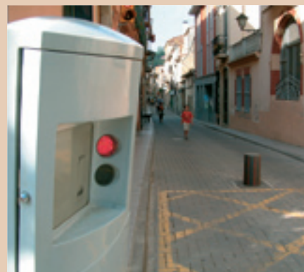
La pilona del carrer de Munt.