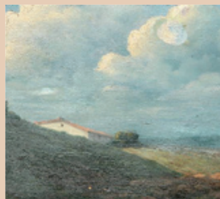
Una de les obres de Mateu Serra.

Les persones amb mobilitat reduïda també poden sol·licitar la seva targeta a la Policia Local.