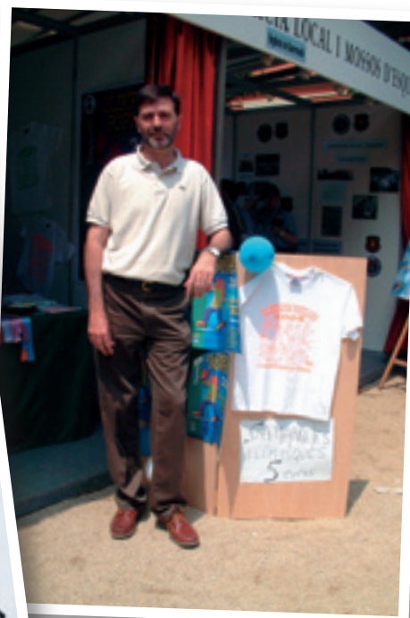
Majó a l'estand per fer les inscripcions i captar voluntaris.