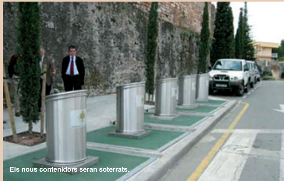
Els nous contenidors seran soterrats.

una altra de les polítiques mediambientals que l'Ajuntament ha posat en marxa ha sigut una auditoria per conèixer de primera mà quines són les preocupacions de tres col·lectius socials ben diferenciats en matèria de sostenibilitat: les entitats, el relacionat amb les activitats econòmiques i el dels polítics.