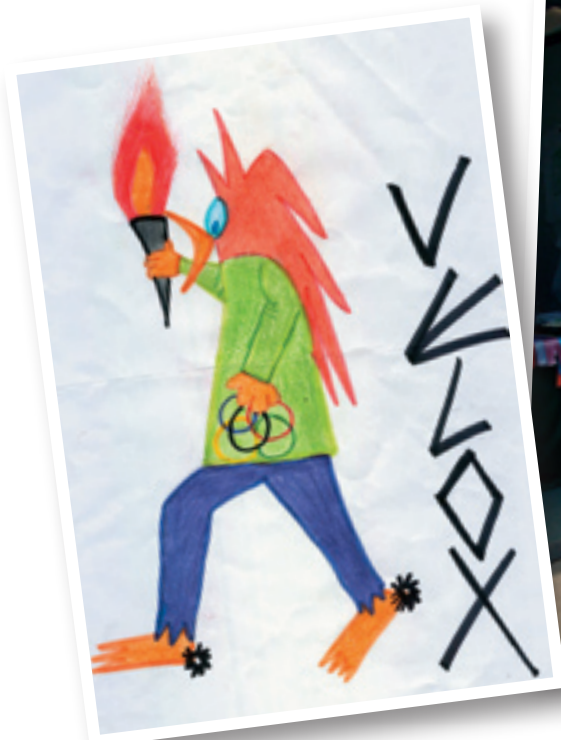
La mascota d'enguany és un gall de colors vius.