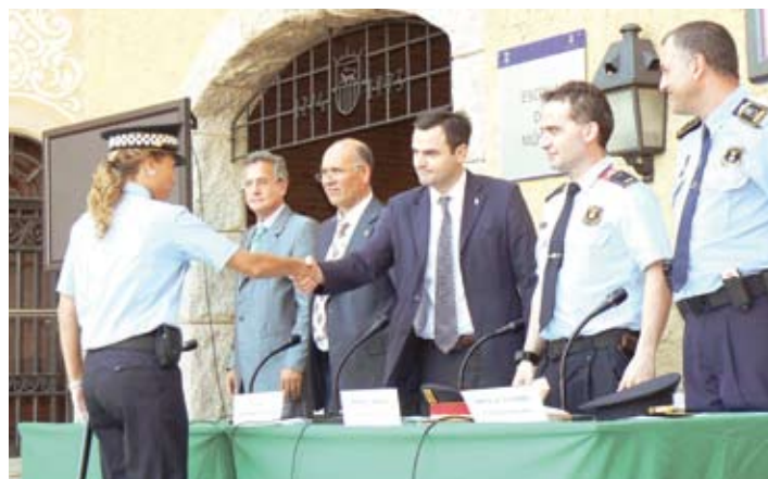
La 3a Festa de la Policia Local es va celebrar als jardins de Can Caralt.