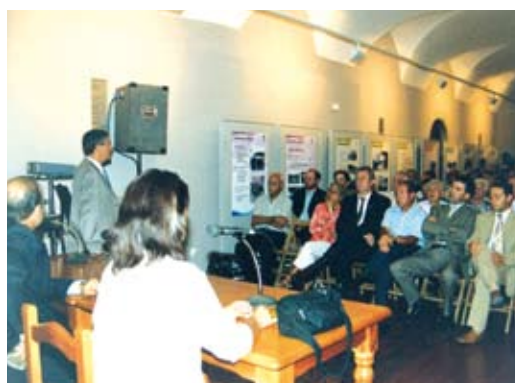
La història del Museu en diverses imatges.

• Diumenges i festius, d'11.00 a 14.00 h