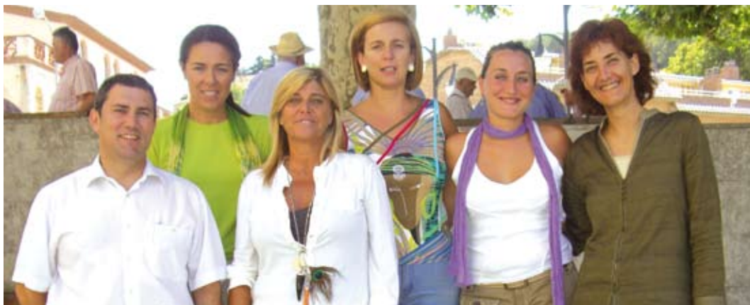
L'equip de l'Oficina d'Atenció al Ciutadà amb el regidor de Recursos Humans.

L'oficina d'atenció al ciutadà també és un punt de compra de diferents abonaments i tiquets -per a la piscina i l'autobús-, i de pagament, amb el 30% de descompte, de multes de trànsit o de zona blava. La compulsua de fotocòpies, l'alta en el cens d'animals domèstics o la informació per a preinscripcions a l'escola bressol municipal, engreixen la llista de feines de l'OAC.