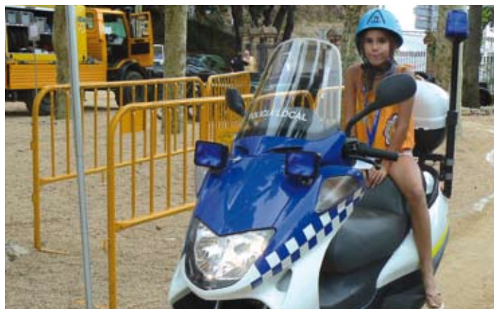
Una participant del Saló de l'Educació Viària, a Ca l'Alfaro.

marca i de les empreses Coratama, Homs, Danone, Nestlé, Jocar, BOR senyalitzacions i Profel SA.