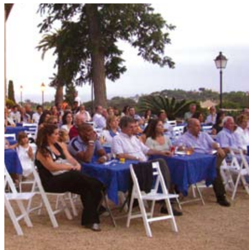
Públic del festival de música.

Pel que fa a l'assistència de públic, la valoració és positiva, sobretot la nit de dissabte.