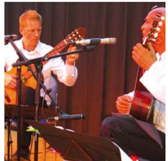
Actuació d'Havana Duet.