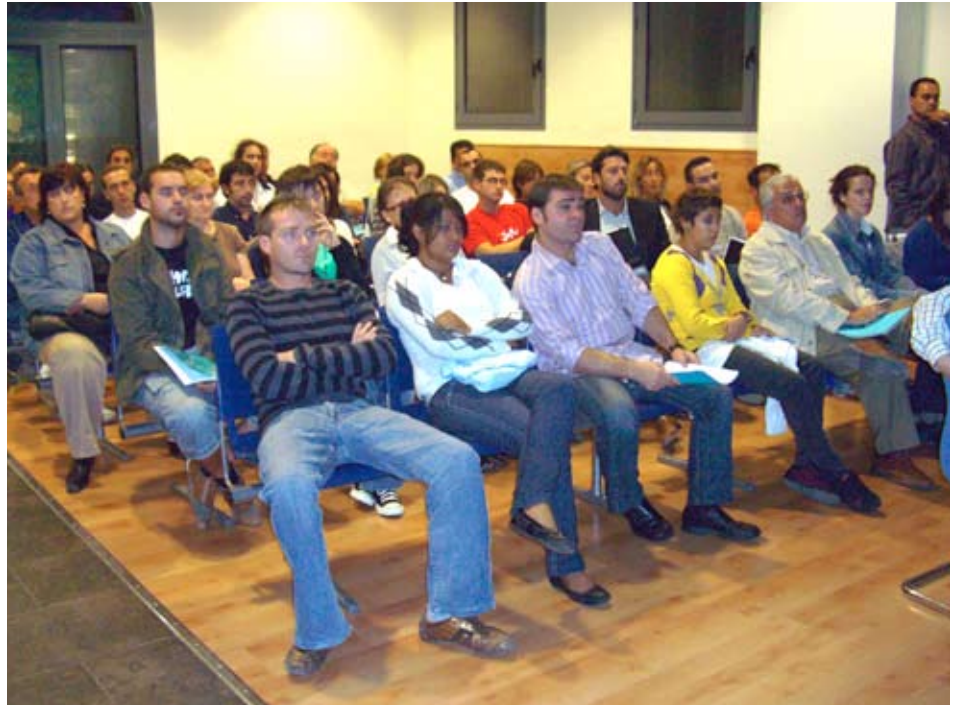
Els adjudicataris dels pisos protegits, en la reunió de l'11 d'octubre, a la sala de plens.

El govern llavanerenc va explicar als adjudicataris aquestes dades i la resta de detalls d'aquest complex procés urbanístic i els va lliurar un dossier amb