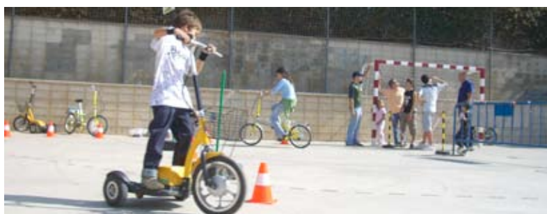
Imatges de les activitats de celebració de la Setmana de la Mobilitat.