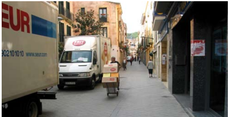
El carrer de Munt serà de prioritat per als vianants.

segur per al vianant. "Aquest és un primer pas en ferm per guanyar espai per a la mobilitat a peu", afegeix. Per fer-ho possible, caldrà combatre la indisciplina i les infraccions en matèria viària i reforçar les mesures de control per evitar l'accés indiscriminat, sobretot de motocicletes. A canvi, aquests vehicles disposaran de noves places d'aparcament en les immediacions del carrer.