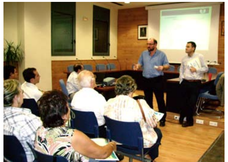
El regidor de Participació i l'alcalde, en la reunió amb les entitats.

*El telèfon publicat a la pàg. 11 de la darrera revista era incorrecte. Disculpeu les molèsties