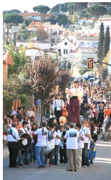
Diverses imatges de la Festa Major de l'any passat.