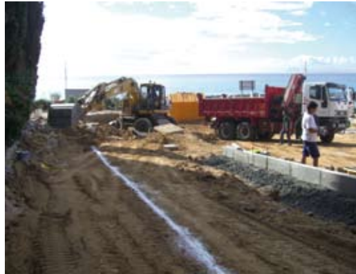
La rotonda s'està construint davant del conjunt residencial de la Marinada.

S'està construint una rotonda, davant de la Marinada, que donarà accés al polígon industrial i al centre urbà