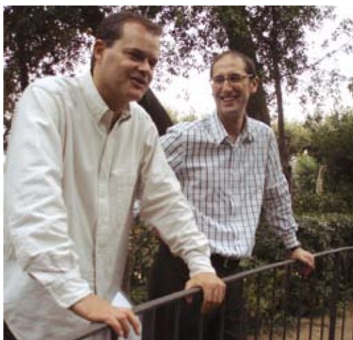
El regidor i el tècnic de Medi Ambient, a Ca l'Alfaro.

tatge de recollida selectiva de brossa i per solucionar els problemes puntuals de desbordament als contenidors. En l'àmbit de la gestió dels espais verds municipals, des de fa temps, es treballa per reduir l'aigua de reg necessària per mantenir-los, alhora que es busca implantar un sistema de gestió ambiental al servei de la jardineria municipal.