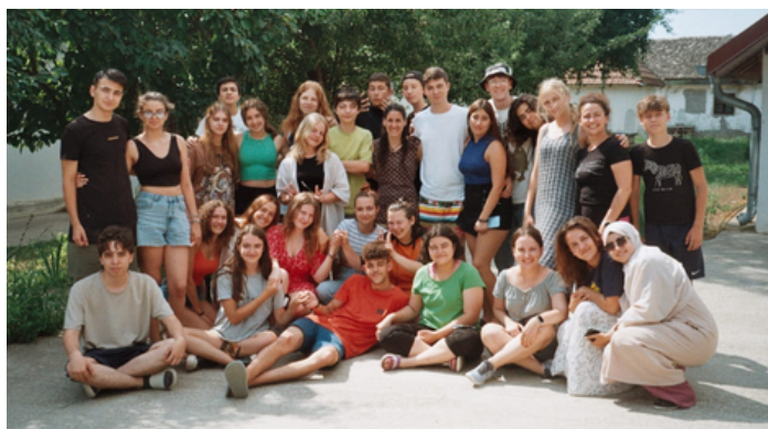
El grup de joves participants en el projecte DIGI-lit