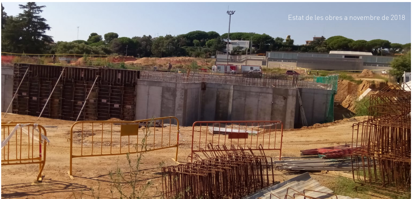
Estat de les obres a novembre de 2018

➔ A dia d'avui, les converses entre l'empresa constructora i l'Ajuntament segueixen vives per tal d'estudiar les vies factibles d'una resolució acordada del contracte.