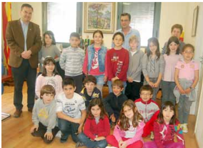
Alumnes de 3r de l'Escola Sant Andreu

Els alumnes de 3r de primària de l'Escola Serena Vall i de l'Escola Sant Andreu van visitar a l'abril les oficines de l'Ajuntament de Llaveneres i es van entrevistar amb l'alcalde, Bernat Graupera. Les visites s'emmarquen en la programació que les escoles del poble porten a terme perquè els alumnes coneguin el municipi i l'Ajuntament.