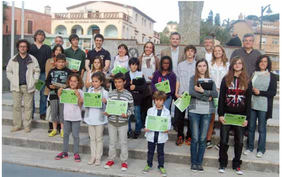
Foto de família dels guardonats en la Mostra Literària 2013, amb autoritats locals i membres del jurat.