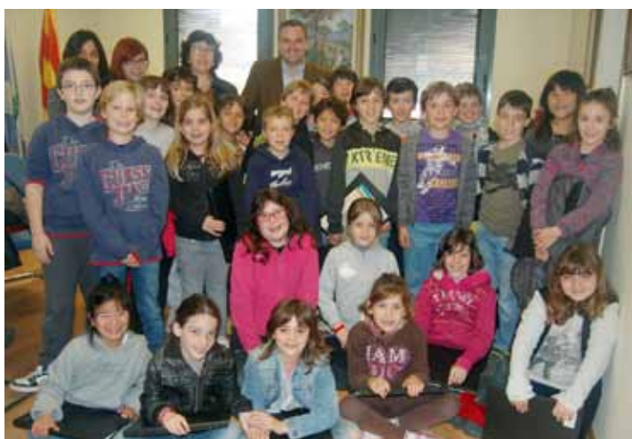
Alumnes de 3r de l'Escola Serena Vall