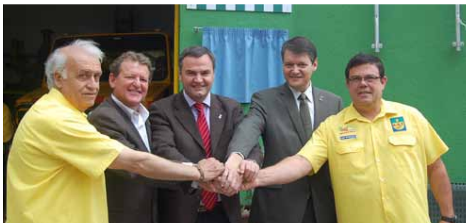
Els alcaldes de les 3 Viles amb els responsables de l'ADF Serralada del Montalt, dissabte 25 de maig en la inauguració.

Forestal sense afany de lucre, formades per propietaris forestals, ajuntaments dels municipis del seu àmbit territorial, voluntaris i voluntàries. Tenen com a finalitat la prevenció i la lluita contra els incendis forestals. Es van regular a partir de l'any 1986 com a conseqüència del programa 'Foc Verd' elaborat pel Departament d'Agricultura Ramaderia i Pesca de la Generalitat de Catalunya. Ara bé, el seu origen cal cercar-lo en els antics grups d'extinció d'incendis i auxili immediat que es van començar a formar a principis dels anys 60 a Catalunya.