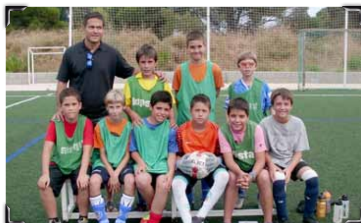
Un dels equips guanyadors de la medalla d'Or en futbol 7.