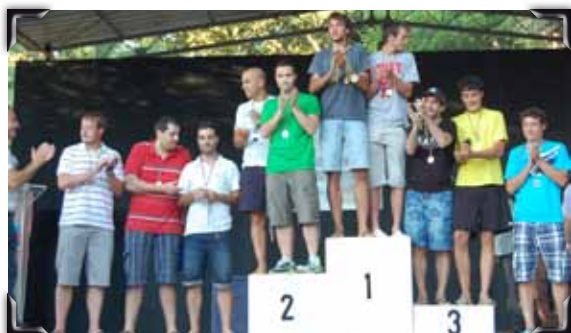
Lliurament de medalles als guanyadors en diferents categories i esports