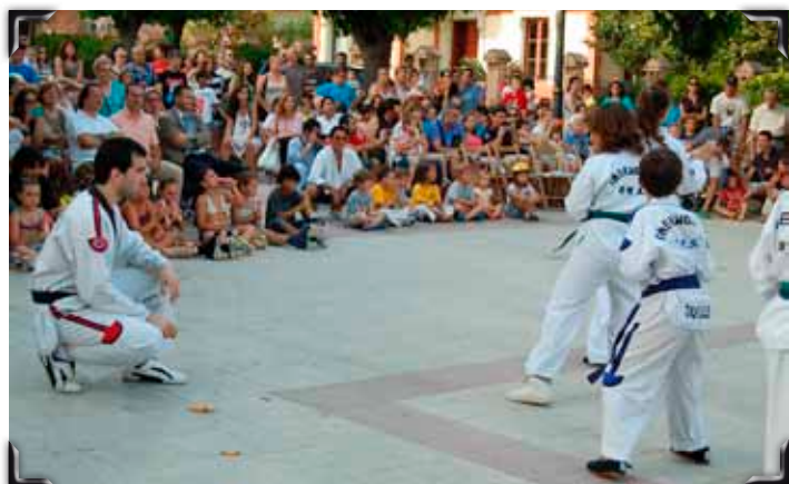
Cerimònia inaugural: actuació del Club Taekwondo Venzalà.