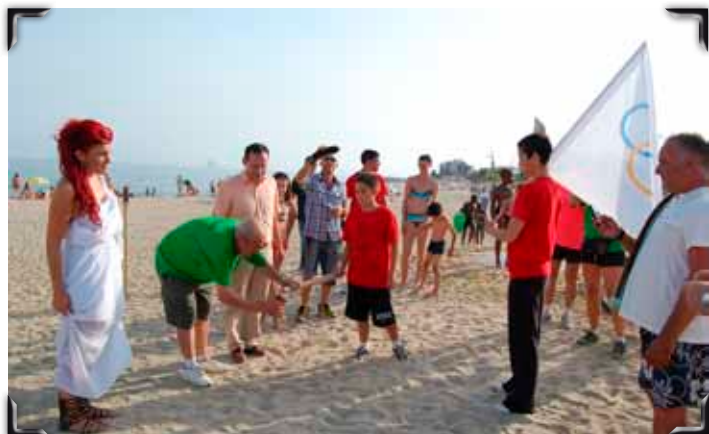
Arribada de la flama olímpica per mar i encesa de la torxa.

ganitzadora, formada per homes i dones de Llavaneres que s'hi han abocat desinteressadament. L'Ajuntament els dona les gràcies públicament i agraeix també el suport de les entitats i dels patrocinadors. Repassem en imatges aquestes 8es Olimpiades de Llavaneres. Podreu trobar més d'un centenar de fotografies al web municipal: www.santandreudellavaneres.cat :