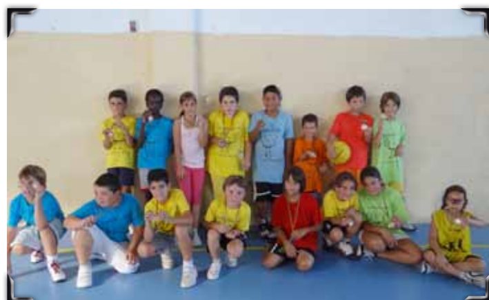
Premiats en bàsquet i altres esports.