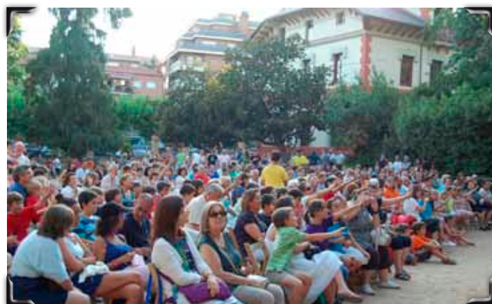
Cerimònia de cloenda al parc de Ca l'Alfaro.