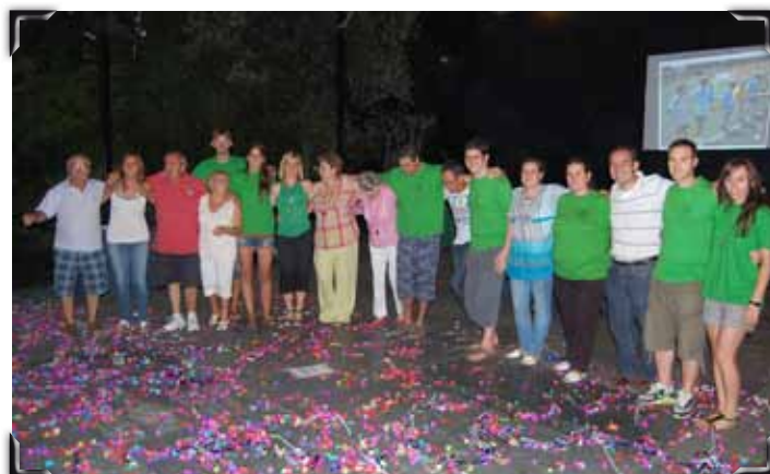
Comiat de la comissió organitzadora.