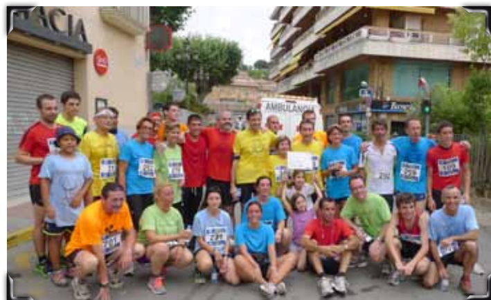
Participants en la prova de 5.000 metres d'atletisme.