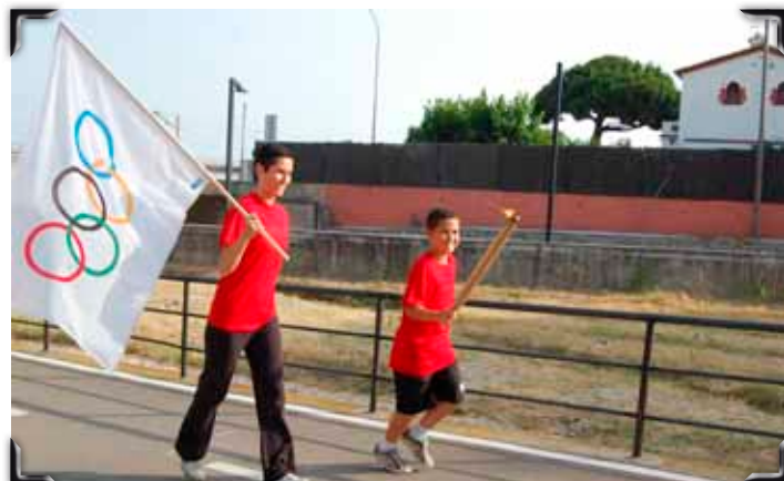
Primer relleu pel municipi amb la torxa.