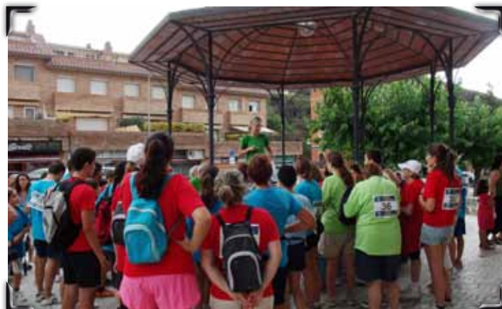
Participants en la cursa d'orientació.