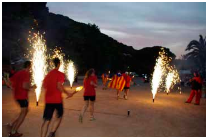
Solsciti d'estiu. Arribada de la flama del Canigó, la nit del 23 de juny, a l'esplanada de Jaume Brutau, amb la gent d'El Casal.

tothom: espectacles infantils, la Nit Jove, la missa solemne, la cercavila de gegants, l'actuació dels castellers, les havaneres amb el rom cremat... Una altra de les novetats de La Minerva 2012 va ser l'estrena de l'Orquestra Montgrins per al concert i el ball de gala, que es van oferir diumenge 15 de juliol. La celebració s'havia obert el cap de setmana del 7 i 8 de juliol, amb propostes com l'Aplec de la Sardana, la 20a Trobada de la Puntaire i la visita a l'exposició de patchwork de la Dona per la Dona.