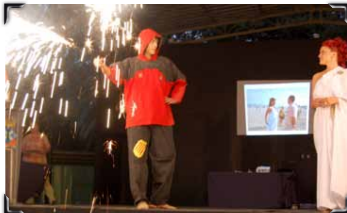
La deessa de l'Olimp torna per recollir la flama.