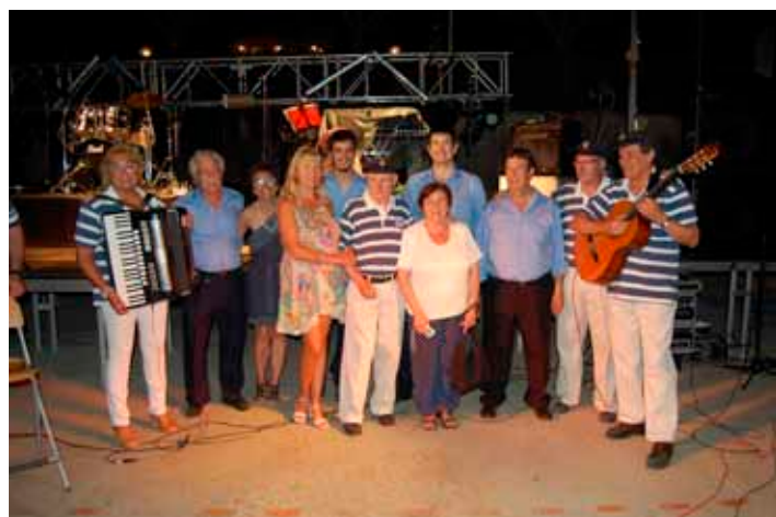
Revetlla de Sant Pere. Llaneres celebra Sant Pere amb espectacle infantil, havaneres, sardinada popular i ball.