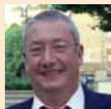
Carlos Bartomeu PP