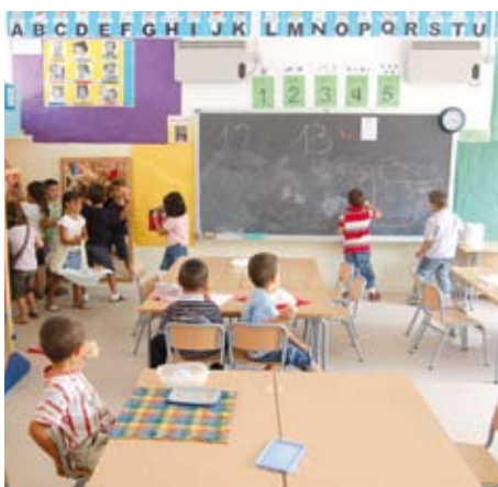
Un alumne aprenent el funcionament de la nova pissarra digital i una aula d'educació infantil del Labandària, en el primer dia d'escola.