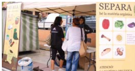
El punt d'informació de la campanya Separa bé la matèria orgànica!

campanya es tancarà el dia 3 d'octubre, disabte, amb una festa al parc de Ca l'Alfaro.