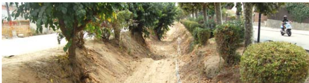
La Riera, després de la neteja.

càrrec de l'Ajuntament, va suposar l'eliminació de tones d'herbes, de canyes i d'escombraries que s'hi havien anat dipositant. Feia tres anys que no s'hi feia una neteja tan a fons.