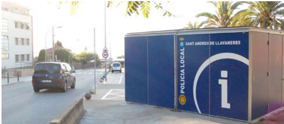
El nou mòdul instal·lat al barri de Sant Pere.

municipals, l'Ajuntament vol millorar l'atenció que reben els veïns dels barris marítics. Aquest mòdul és provisional, ja que la voluntat del consistori és que, en un futur, es pugui construir un equipament municipal nou en aquesta zona. Un altre dels objectius és que aquest espai serveixi com a punt de trobada des d'on incrementar la presència policial al barri.