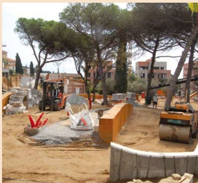
Obres al parc de Can Rivièrè.

Continuen endavant altres obres finançades amb els fons estatals, com ara la rehabilitació del sostre i de la façana de Ca l'Alfaro i la urbanització de la rotonda de l'N-II. Altres de les actuacions previstes ja s'han enllestit: les reformes al pavelló i al CEIP Labandària i el passeig marítim. També hi ha en marxa les obres de repavimentació de la plaça de la Vila.