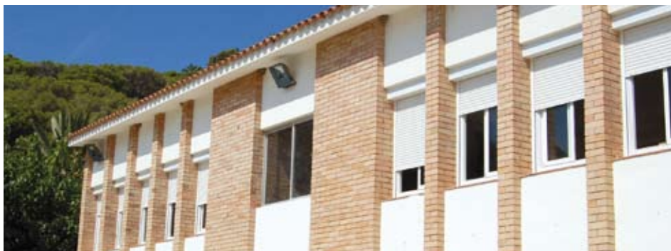
S'ha reformat l'antic aulari de l'escola Labandària.

Les obres de remodelació de l'aulari més antic del CEIP Labandària s'han executat durant les vacances escolars d'estiu. El projecte s'ha finançat amb el Fons Estatal d'Inversió Local (FEIL) i ha suposat la millora integral de l'espai. L'interior de l'edifici s'ha dotat de calefacció; s'hi ha col·locat fusteria d'alumini; s'hi ha canviat la instal·lació elèctrica i s'ha pintat. El pati posterior s'ha pavimentat per evitar filtracions d'aigua i s'hi ha habilitat un espai delimitat de sorra perquè els alumnes el transformin en un hort urbà.