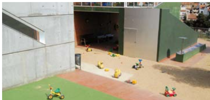
L'aspecte que ofereix ara el pati de la llar d'infants Minerva.

L'eliminació del mòdul instal·lat al pati de l'Escola Bressol Minerva permet aquest curs gaudir de més espai de lleure exterior. Un cop retirat el mòdul, l'Ajuntament ha repavimentat l'espai amb un conglomerat de cautxú especial per als jocs infantils. També s'ha fet una millora en l'accessibilitat al centre. Tot i que de manera provisional, ja que el sector està pendent de desenvolupar-se, el consistori ha habilitat una vorera a l'avinguda de Ca n'Amat per facilitar l'accés de les famílies amb els cotxets dels nadons.