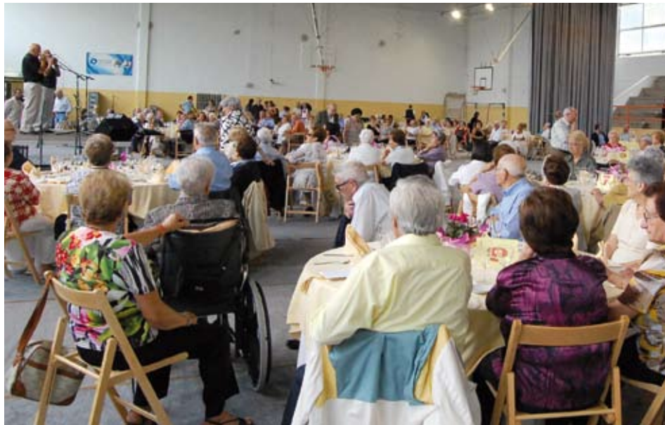
Assistents al dinar de germanor de l'Homenatge a la Vellesa, al pavelló municipal.

Andreu i el dinar de germanor al pavelló municipal, amenitzat amb actuacions i molta música i diversió. L'homenatge, l'organitza el Patronat Local de la Vellesa i està adreçat a les persones de Llavaneres de més de 75 anys.