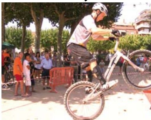
Demostració de trialsin, en la presentació del nou club de BTT.