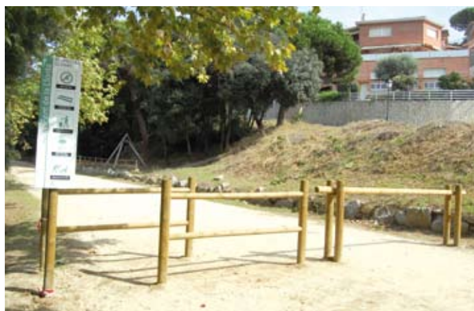
Tancament al trànsit del parc de la Llorita.

L'Ajuntament de Llavaneres ha instal·lat aquest estiu dues tanques a la part inferior i superior del parc per convertir-lo en un espai lliure de vehicles, un pulmó verd exclusiu de vianants. Les obres de millora es completaran aquesta tardor amb la delimitació d'un corredor verd a tocar de la Riera i amb la instal·lació del mobiliari nou.