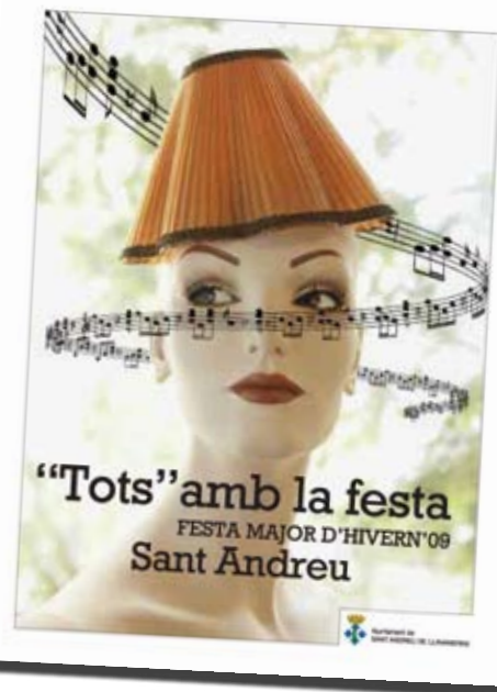
Cartell de la Festa Major de Sant Andreu 2009, guanyador del concurs.

Com és tradició, el programa de la Festa Major inclou una nova edició de la festa gastronòmica de Promoció de Productes Típics, que compleix onze anys i que anirà acompanyada de la fira Alimentabò. La trobada serà el cap de setmana del 21 i el 22 de novembre, al passeig de la Mare de Déu de Montserrat. A més de visitar la fira de productes típics, es podrà participar en la degustació popular, que inclourà la tradicional poma farcida, bolets i coca de Llavaneres. A més, del 20 al 30 de novembre, als restaurants