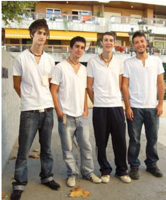
Els quatre agents cívics joves, a la plaça de la Vila.

oferir als joves oportunitats d'ocupació dins el propi municipi i, en aquest sentit i valorant la tasca feta, el balanç és molt positiu. A través d'aquesta iniciativa, els joves han conegut el funcionament intern de l'Ajuntament i han tingut la seva primera feina.