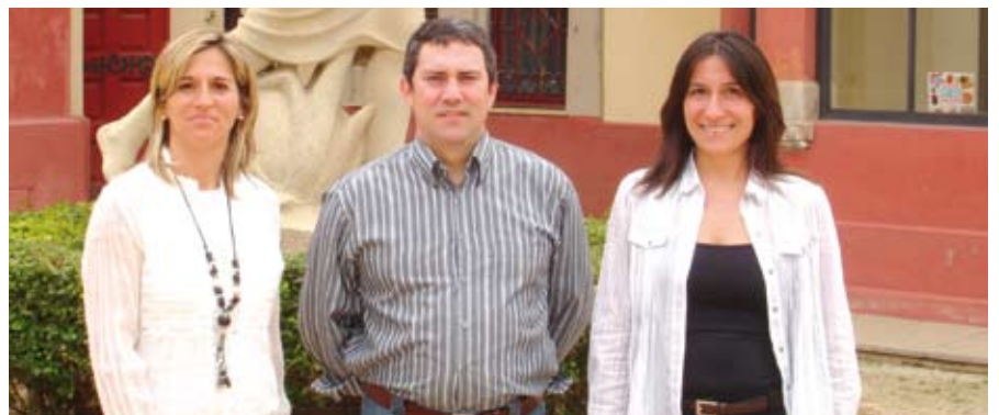
El regidor i les tècniques de Promoció Econòmica, Comerç i Turisme a Ca l'Alfaro.

La Regidoria ha liderat la creació de la marca de Les 3 viles i en promou la difusió en els àmbits empresarials a través d'accions com el cicle Les 3 viles i la responsabilitat social corporativa (RSC), turística i comercial. El cicle de RSC té per objectiu fomentar el compromís de l'empresa amb la societat a través de la millora de la qualitat de l'ocupació i l'aplicació de mesures de conciliació de vida laboral i familiar per augmentar la productivitat.