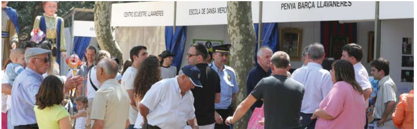
Aspecte de la darrera edició de la mostra d'entitats.

D'altra banda també hi participaran, per primer cop, l'Associació de Empresarios y Profesionales, la Penya Perica de Llavaneres i el Dakar Solidari Llavaneres.