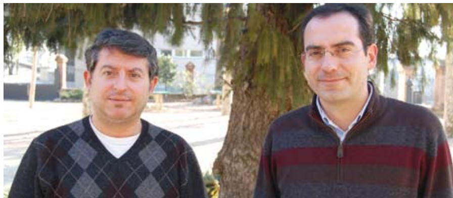
El tècnic auxiliar i el regidor de Cultura, fotografiats als jardins de Ca l'Alfaro.

Una de les tasques de la Regidoria és atendre i vehicular les iniciatives que puguin sorgir de les entitats i de personalitats relacionades amb el món de la cultura. De fet, bona part de les propostes del cycle festiu anual es porten a terme amb el suport de l'Ajuntament però impulsades per les associacions.