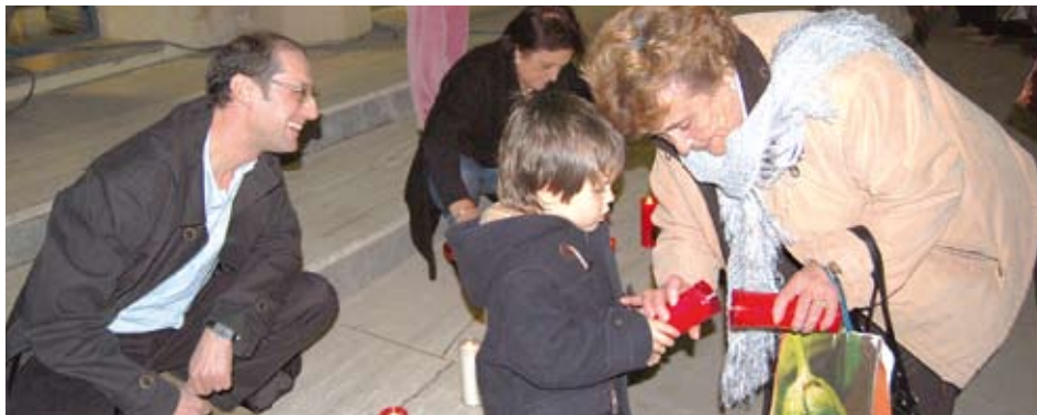
Els alumnes guanyadors del concurs de dibuix i narració, i l'acte solidari d'encesa d'espelmes.